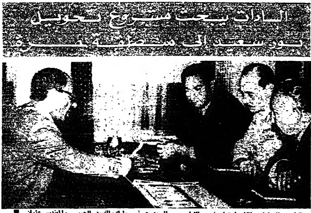
الرئيس السادات أثناء اجتماعه مع السيد حسني مبارك والوزير القومي المهندس عثمان

بحث الرئيس أنور السادات أمس مع المهندس عثمان أحمد عثمان وزير الإسكان والتعمير المصري، والمشروع الذي يهدف الى تهيئة حرة اعتباراً من 5 حزيران المقبل. وقد وافق المجلس على منح رؤوس الأموال المصرية المودعة من الخارج نفس المزايا المنوحة لرؤوس الأموال العربية والاجنبية لتستخدم في الاستثمار. القاهرة - أ.ش. 1